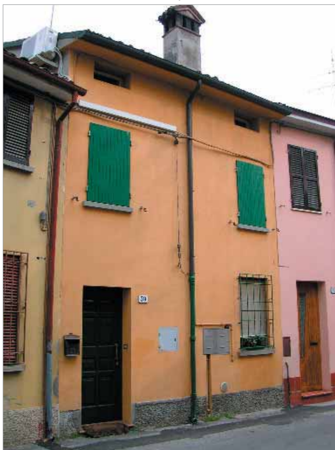
Via Berti 39 Fronte Principale